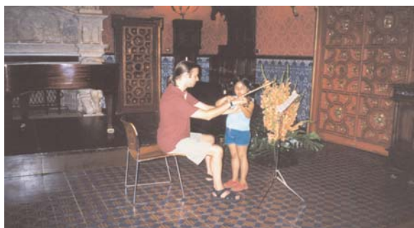
En el Mètode "Cos-Art" la preparació psicofísica és essencial per aconseguir que el cos transmeti els seus impulsos emocionals amb la màxima harmonia.